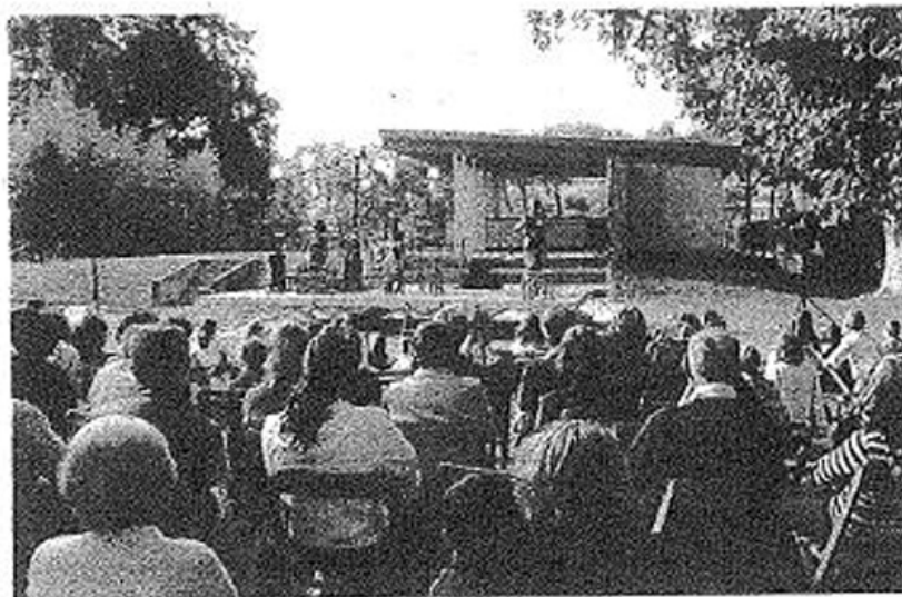
Le spectacle a séduit un large public