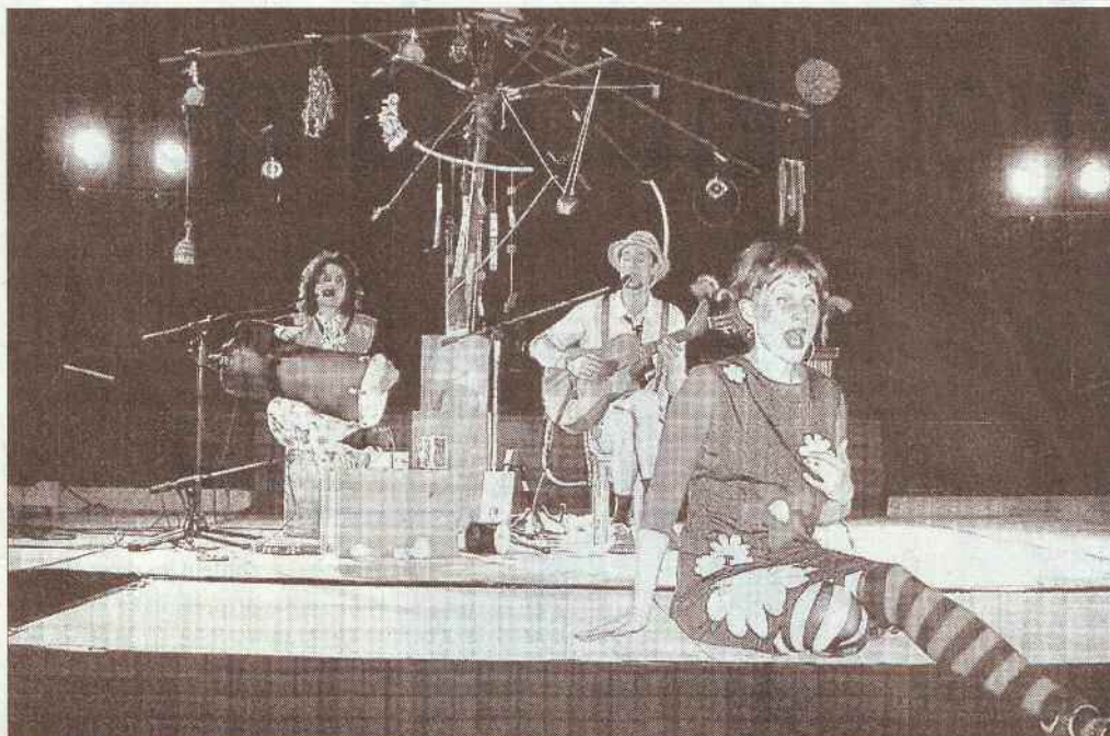
La compagnie «Fabulle et les Rakikontes» a joué son spectacle musical devant plus de deux cents enfants réunis dans la salle Jacques-Prévert.

Cela se passe à une époque où il y a déjà toutes sortes d'animaux sur la Terre : des lions, des taupes et des libellules, des globicéphales et des térébratules. « Tout un tas de drôles de bêtes circulaient sur la planète ; des animaux poilus ou "plumus", griffus ou dentus, mais pas de vache, que je sache ! Et il y a aussi des hommes, la tribu des Jentravequepouik, qui vivent dans l'herbe : leur maison et leurs vêtements sont fabriqués avec de l'herbe. Et que mangent-ils ? De l'herbe ! Ils broutent ! Mais ils n'aiment pas ça du tout... Sauf une dame nommée Mama Galamilk qui aime tellement brouter qu'un jour, après avoir brouté toute l'herbe du village, elle est chassée par le chef qui lui dit : "Ne reviens que si tu ramènes avec toi la solution !" » Alors, Mama Galamilk est chassée du village. La trouvera-t-elle et quel est cet arbre merveilleux qui exauce les vœux les plus chers ?