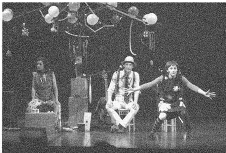
La Cie Fabulle a remporté un franc succès à l'Opéra.

■ Cette année, pour la fête de la musique, les enfants ont été gâtés : plusieurs associations ( Culture Kids, Petit Potin, Allez les Filles ) leur ont concocté un menu aux petits oignons, en partenariat avec l'Opéra National de Bordeaux, qui a accueilli ateliers et spectacles gratuits toute la journée du 21 juin. Après Le Carnaval des Animaux de Saint-Saëns, et dans la grande salle comble, la Compagnie Fabulle et les Rakikonte est venue couronner le tout, en nous faisant découvrir Comment est apparue la vache !